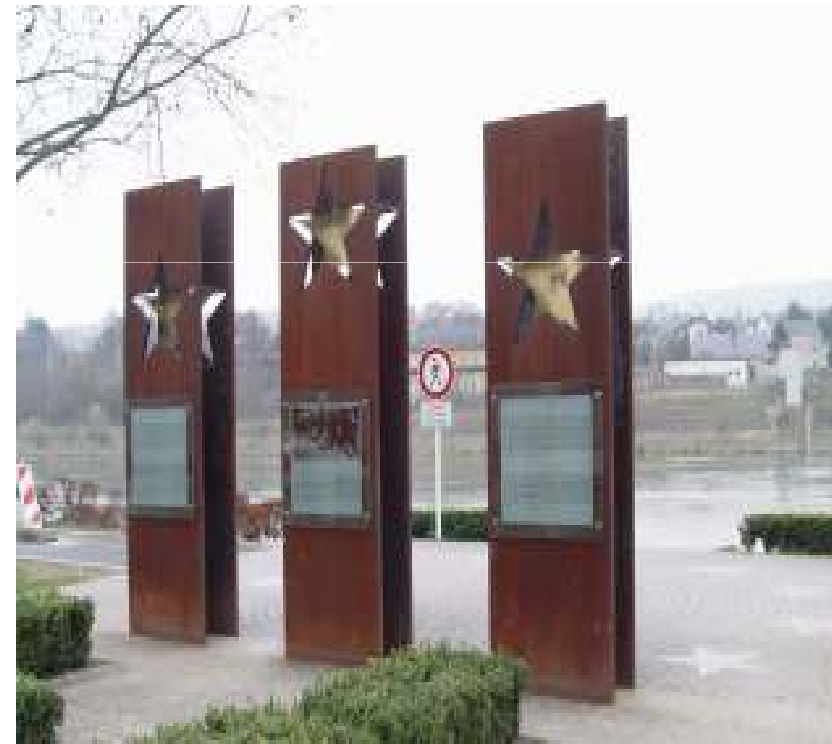
A schengeni egyezmény emlékműve Schengenben, a folyóparton, csupán méterekre onnan, ahol a Princesse Marie-Astrid hajó horgonyzott (az Egyezmény aláírásának helyszíne)